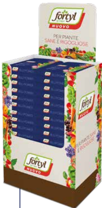
PALL-BOX DISPLAY 59,5 x 143 x 39,5 cm