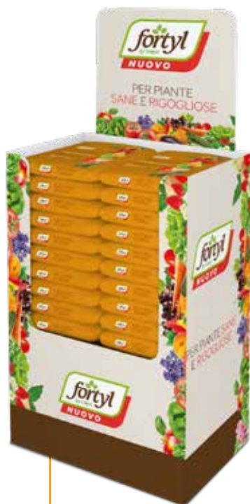
PALL-BOX DISPLAY 59,5 x 143 x 39,5 cm