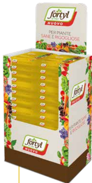
PALL-BOX DISPLAY 59,5 x 143 x 39,5 cm